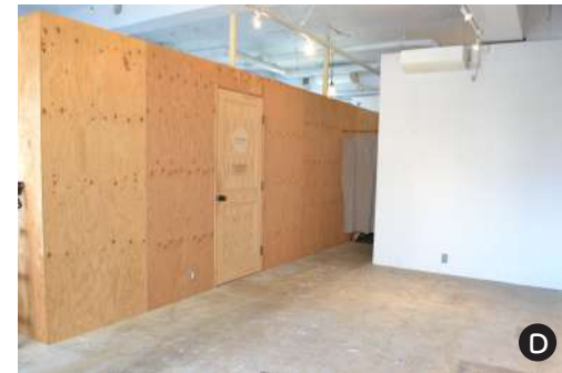
オフィス側の壁（木目）の高さは2280mmです。